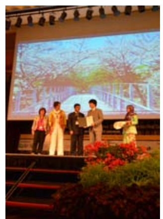
受賞式と受賞スピーチの様子